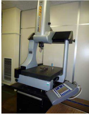
1.三次元測定機 Micro-Hite 3D